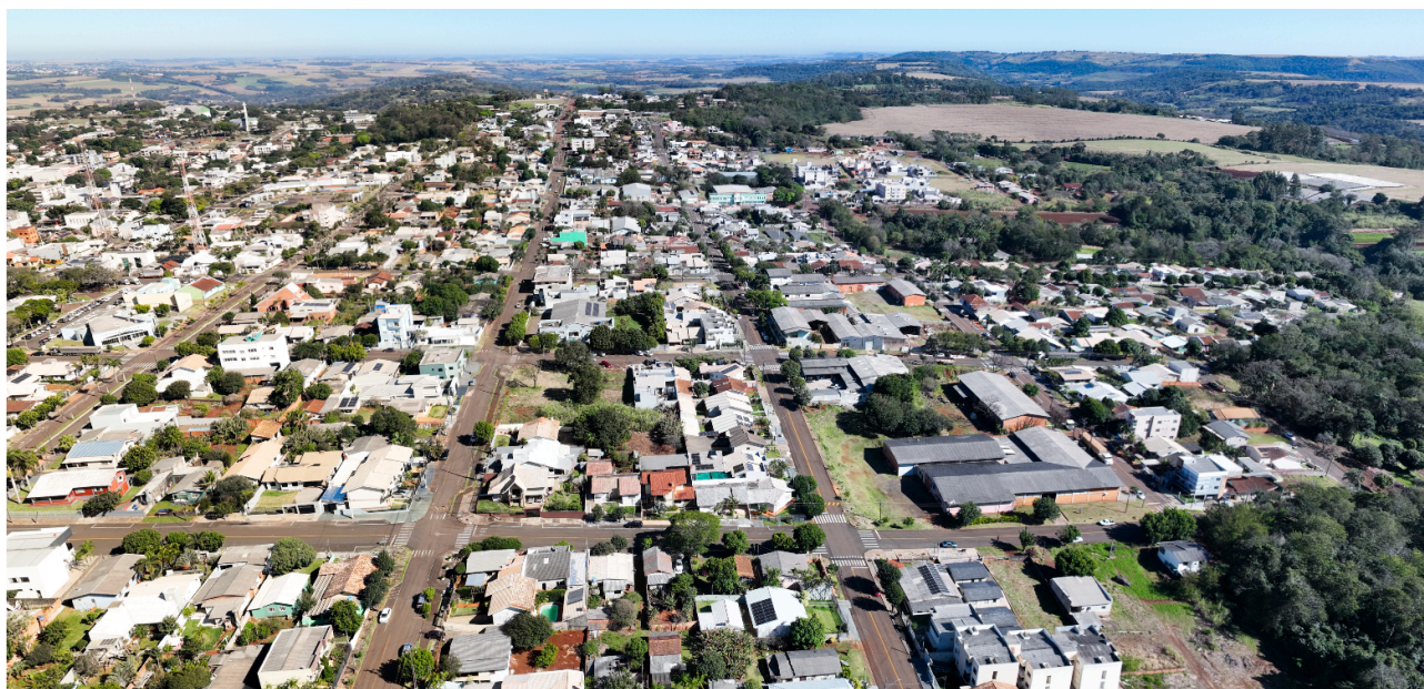
Figura 04: Imagem 360 graus aérea

permitindo a análise por diversos ângulos, conforme Figura 04.