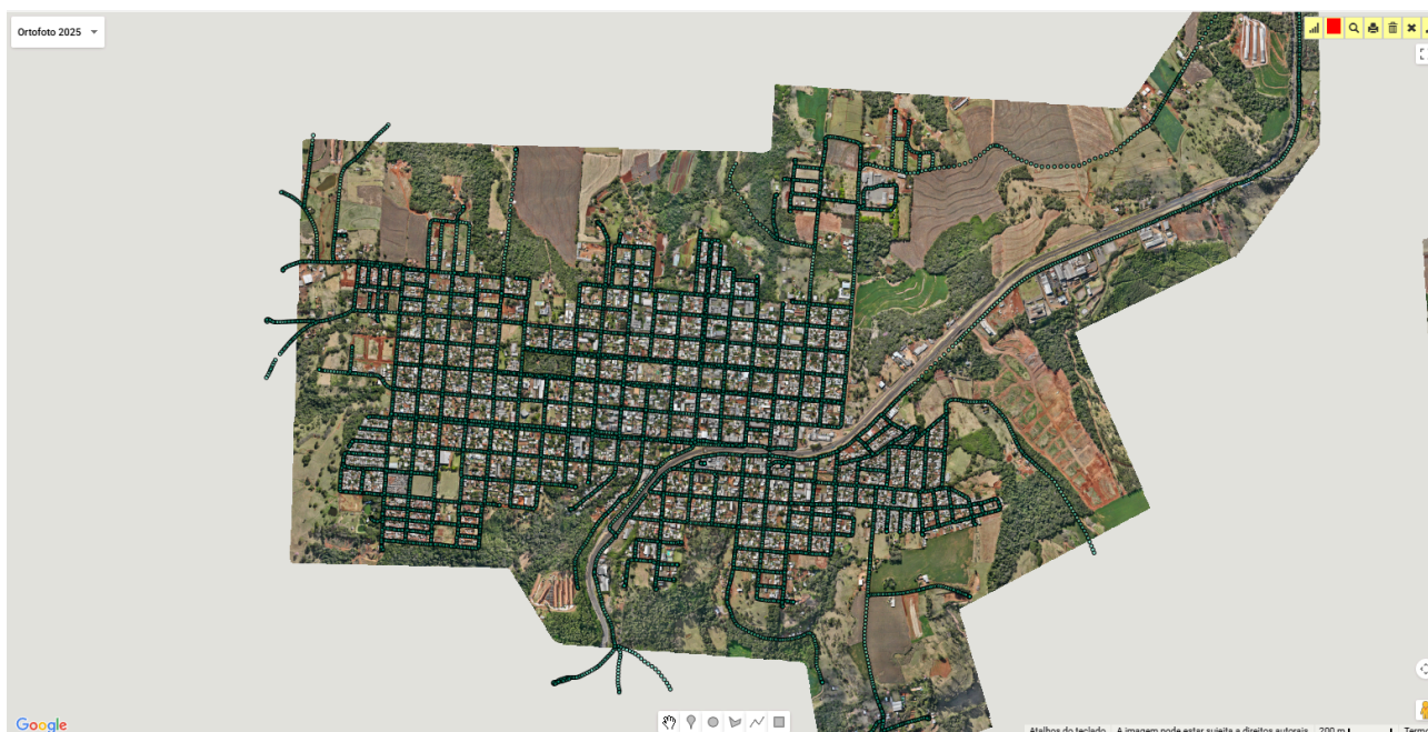
Figura 02: Rotas das imagens 360 graus disponíveis.