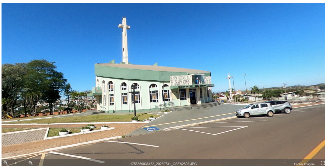
Figura 03: Imagem 360 graus disponível em ambiente SIG WEB.

Além disso, também foram realizados levantamentos fotogramétrico aéreo multidirecional, denominados de “Imagens aéreas 360 graus”. O serviço foi realizado utilizando um Drone para capturar as imagens e softwares especializados para realização do processamento. Essas imagens possuem resolução em 16K garantindo a qualidade e eliminando possíveis distorções nas emendas das fotografias.